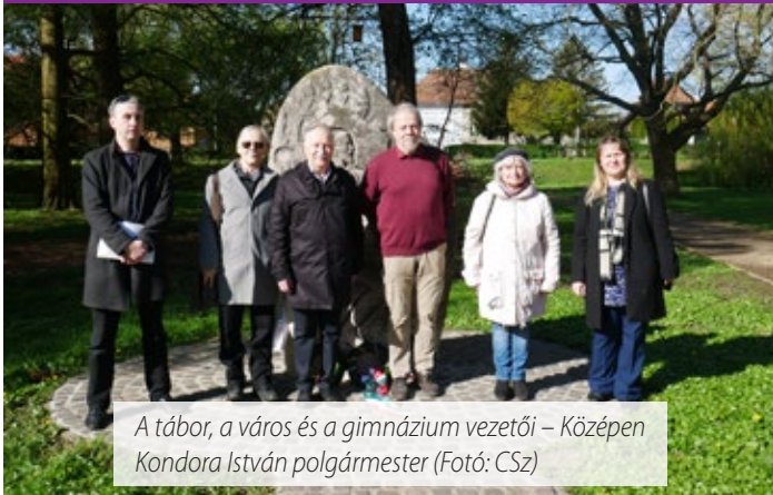
A tábor, a város és a gimnázium vezetői – Középen Kondora István polgármester

Az Írók Alapítványa, az Írók Szakszervezete, a Sárvári Tinódi Gimnázium és Sárvár Város Önkormányzata 2024-ben is meghirdette a Kárpát-medencei Középiszolás Irodalmi Pályázatát, és megszervezte az alkotótáborát Sárváron.