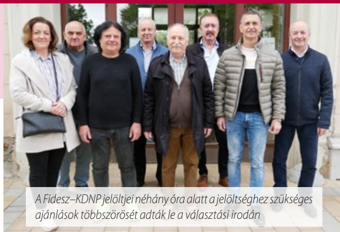
A Fidesz–KDNP jelöltjei néhány óra alatt a jelöltséghez szükséges ajánlások többszörösét adták le a választási irodán