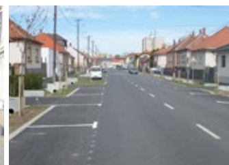
Berzsényi Dániel utca

A projekt megvalósítását Sárvár Város Önkormányzata és a Vas Vármegyei Önkormányzati Hivatal konzorciumi formában bonyolította le.