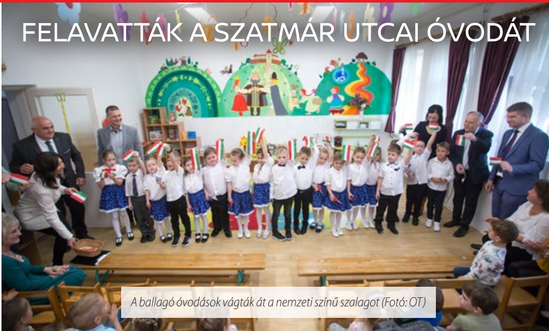
A ballagó óvodások vágják át a nemzeti színű szalagot

A Szatmár utcai óvoda ovisainak ünnepi műsorával avatták fel az intézmény megújult épületszárnyát április 11-én. Többek között új külső színezést kapott az épület, amely energetikai korszerűsítésen is átesett, tornaszobával, egyéb új helyiségekkel is bővült.