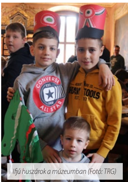
Ifjú huszárok a múzeumban